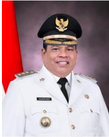
SUHATRI BUR Bupati Padang Pariaman